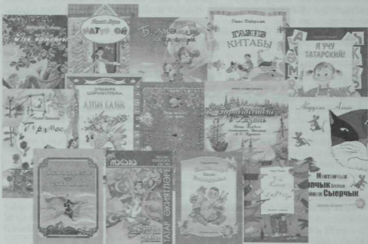
«Мәгариф» нәшрияты китапларынан бер тамчы.

Русиядә китапны кулына тотып та карамаучылар саны «демократия» елларында бер ярым тапкырга (23 проценттан 34,2 процентка) арткан. Әллә нигә бер «ачып караучы»ларны да кушсан (тагын 39,5%), укымаучылар өлешә 73,7 процент, ягһни дүрт кешенә өчәсе булып чыга. Русиядә бүгән 16 яшыккә хәтлә бер миллион икә йөз мең кешә укый-яза белми икән. Үзәбезнең милләт көзгесенә карасак, андый статистика мәгһүлүм түгәл, анализ белән шөгһильләнүчә юктыр, күрәсен. Шулай да матбутатыбыз, китап басмаларыбызның ничек таралуынан, югары уку йортындагы кавәмдәш студентларның белем дәрәжәсеннән азы-күпмә хәбәрлар кешә, Тукайга ияреп: «Халкыбыз шул бик надан», - дип уфырырлык... (Гомумиләштерүгә дәгһва итмичә үткәрилгән бер ачы тәжрибә: татар студентларының байтагы, мөсәлән, кешенә гәләмгә беренчә тапкыр кайчан очкандыгын якынча булса да белми, милли мәдәни мохиттан Азат Аббасов, Сажидә Сөләйманова кебек шәхәсләреннә кайсы өлкәдә танылган булуын әйтә алмый.)