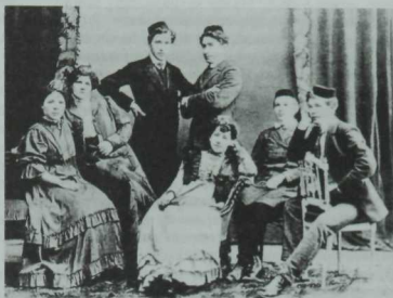
«Сәйяр» труппасы. 1909 ел.

Спектакльләр барышында әйләнә-тирәдәге чынбарлыктан алган күзәтүләрне Г. Кариев билгеле бер идея концепциясенә буйсындыра һәм аларны эстетик яктан оештыра. Ә ижат ителгән образлар табигате, характерлар төрлелеге башкаручы актерның шәхси тәҗрибәсе тирәнлегенә, режиссерның сурәтләнгән тормышны ни кадәр яхшы белүенә бәйле. Алда билгеләп үтелгәнчә, тормышчан театрда иң мөһиме — чынбарлыкны дөрес, төгәл гәүдәләндерү, аңа мөмкин булган кадәр яқын килтү. Нәкъ менә шушы принципны төгәл саклаганга күрә дә Г. Кариевның иң яхшы спектакльләрендә барысы да «тормыштагыча» була. Рампа янында күзгә күрәнми торган «дүртенче стена» үсеп чыга, ә аның артында тормыш үзе — театр шартлылығыннан азат тормыш бара. Табигать күренешләрендә сәхнә мәйданы кин, офыкка кадәр сузылган, бүлмәләр, кешеләр яши торган бүлмәләр шикелле унайлы, акшарланган миңләре жылы булмыш күрәнү зарур. Тәрәзәгә янгыр бәрәп яварга, моржада жыл уларга мөмкин һ. б. Шундый детальләрдән, төсмерләрдән тере сәхнә атмосферасы барлыкка килә. Монда, аерым төсле таплардан, сызыклардан, нокталардан төзелгән сурәтләрдәге кебек, бөтен нәрсә, әйтсәң, үзара бәйләнеп бара: актерның салынган иңбашлары, ярым ачык ишектән саркылган яктылык, идәнгә ташланган уенчык, жылнең моржада эчпошыргыч улады — барысы да гомуми атмосферага «хезмәт итә», бердәй рухта була, төгәллек хисе тудыра.