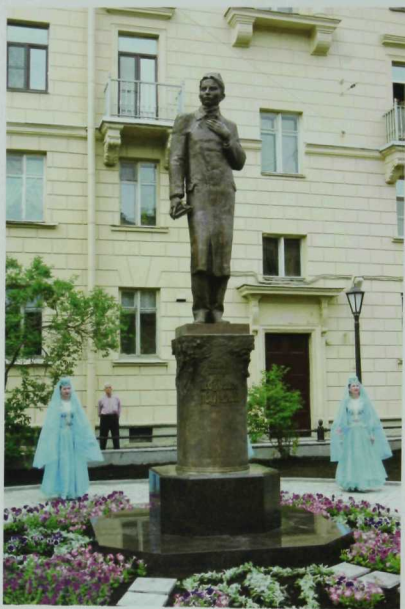
Петербургта Габдулла Тукайга һәйкәл ачылды. Июнь, 2006 ел.