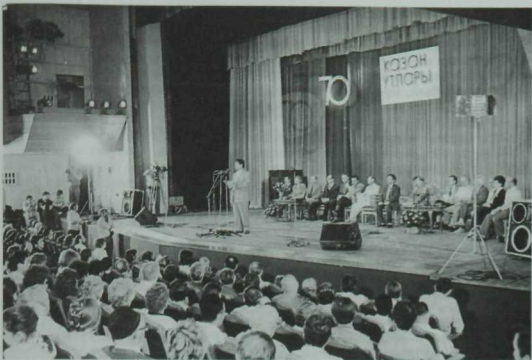
Әхмәт Галиев «Казан утлары» журналының юбилей кичәсендә чыгыш ясып. 1992 ел.