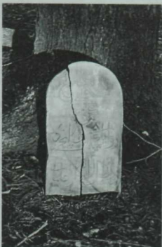
Сабай авылы зиратында Гыйльман хәзрәт Яхин (1801—1853) кабере өстенә куелган таш.

Шактый ук туды тексты эпиграфик истәлекләр тагын берничә авылда бар. Менә шундыйларнын берсен Кызыл Мишә авылы зиратында очраттык: Ёижри 1328 сәнәдә (мөселманча ел исәбе белән 1328 елда) маһе рәжәбнен (рәжәп анын) 2 нче йаумендә (көнәндә) карьян Пүскән (Пүскән авылынын) имам Габделәхәт