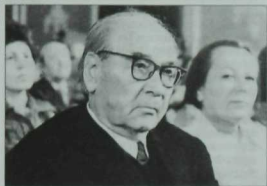
Мәшһүр галим һәм әдип Нәкый Исәнбәт. 1979 ел.