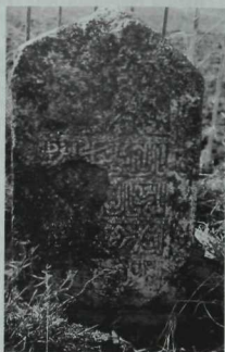
Олы Шыңар авылы басуында сакланган Казан ханлыгы дəверə ташязма истəлеге.