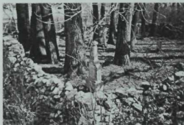
Казанчы Бигәнәй авылындагы “Ишан зираты”ның гомуми күренеше.