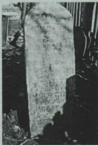
Кече Шынар авылында сакланган Казан ханлыгы дәвере (1524 ел) кабер ташы.