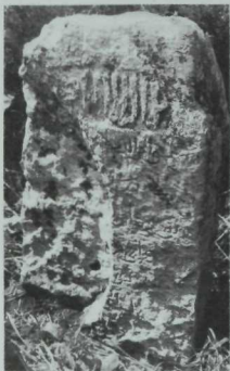
Эзмә авылы басуындагы каберлектә сакланган XIV йөз кабер ташларының берсе.

Без 2001, 2002 һәм 2004 елларның яз-көз айларында районның 62 татар авылында булып, зиратларын, каберлекләрен тикшердек һәм алардагы эпиграфик истәлекләрен укып, язып алдык, фоторәсемгә төшердек. Барлығы 218 борынгы кабер ташы табылу һәм теркәп алыну—Саба районы авылларының тарихи ташъязма истәлекләргә шактый бай булуын дәлилли. Аларны барлау, нигездә, төгәлләнде дисәк тә була. Гомуми нәтижәләрен туплап журнал укучылар игътибарына тәкъдим итәбез.