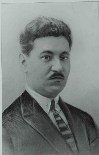
Мәхмүт Галәү (1886 –1938)