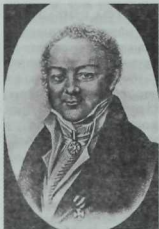
Фото яисә рәсемнәрдә сакланып калган сурәтенә карап, аның кемлеген төсмерләп карыйк әле. Бөдрә чәчләр, кин маңгай, кыйгач кара кашлар, көләч һәм кешелекле йөз карашы, утыртма яканы һәм шул заман кешеләренә хас рәсми киёмнәр, орден һәм медальоннар... Кыскасы, аның йөз-кыяфәтеннән ақыл һәм зыялылык бөркелеп тора. Ә тормышта һәм кешеләр белән аралашудагы төс-кыяфәтен, жигди көләчлеген вақыт галижанабләре генә яхшы хәтерләп калгандыр, могаен.

Аны Казанда гына түгел, бөтен Европада диярлек яхшы белгәннәр. Төрле һөнәрләреннән тыш, ул әле атаклы библиофил (китапханә остасы) да булган: өендә аның татар һәм урыс телләрендә бик күп кулъязмалар сакланган. Казандагы 1842 елгы көчле янгың вақытында ул үзенен төрледән-төрле коллекцияләрен (натуралист, биолог, минераллар белгече һ. б.) ярдәмчеләреннән башка берүзе ташый һәм сәламәтлегенә шактый зыян китерә.