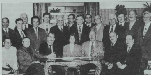
ПЕН-Үзәгенәң чираттагы утырышынан соң. 1994 ел.