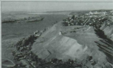
Борынгы Алабуга шәһәрчегенең гомуми күренеше. 1996 елда төшерелгән фото.