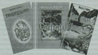
Ф. Сафин китапларының берничәсе.

«...«Ирек»—дип чыктык сәфәр...» шигырендә дә сәфәр, юл, сукмак, упкын