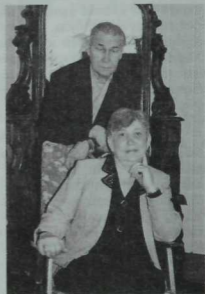
Лирон, Дания—бергә гомәр итүләренә кырык ел тула.

Лирон Хәмидуллинның соңгы ике китабына кәргән яки вакытлы матбугатта, шул исәптән «Казан утлары» журналында басылган соңгы дәвәр әсәрләренән төп темасы милләт язмышын кайгыртып яшәгән шәхесләр эшчәнлегенә бәйлә (укучыларнын исенә төшереп китик: мөшһүр гармунчы Фәйзулла Гуишевка багышланган повесте журналыбызнын быелгы ситезенче санында басылды). Үз милләтенен киләчәгә өчен жан атып яшәгән зыялыларыбыздан Дәрдемәнд, Галимжан Ибраһимов, Габделбари Баттал, Йосыф Акчүра, Камил Мотыйгий һ. б. багышланган документаль повесть, очерк, эссе кебек әсәрләрен автор, минем карашымча, шулай ук үз халкына файда китерим дигән максаттан чыгып башкарды. Әйтик, Г. Ибраһимовның биографиясен һәм ижатын барлаудагы кайбер