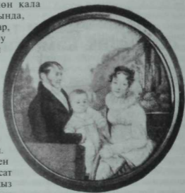
Фуксның гаилә портреты.

Һәр кунак киләнгә нинди дә булса бүләк алып килергә тиеш. Якын туганнары кыйммәтле парча, күлмәклек тукыма, алтынсу яулык кебек затлы әйберләр салсалар, бүтәннәр инде калфак, күлмәккә ефәк тасма, яки бизәргә укалы тасма, калфак бизәргә чуклы, чачаклы тасма ише әйберләр бүләк италәр. Һәр килгән кунак, күрешеп чыкканнан соң, бүләк куела торган махсус өстәлгә килә. Хужабикә кем нәрәс бүләк иткәнән һәммә кунакка күрсәтеп чыга.