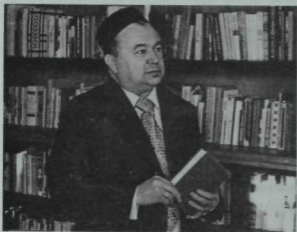
Шагыйрь Мәхмүт Хосәен. 80нче еллар.