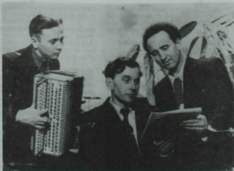
Мәшһүр артистлар. Сулдан уңга—баячы Мохтар Әхмәдиев, жырчы Рәшит Ваһапов, нәфис сүз остасы Фәйли Йосыпов. 50 иче еллар.