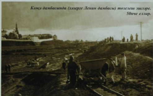
XX гасырда алынган фотосурәтләр.