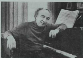
Композитор Нәҗип Жиханов. 1981 ел.