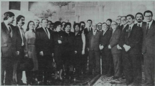
РСФСР язучылар съездында катнашкан Татарстан язучылары Кремль залында. 1985 ел.