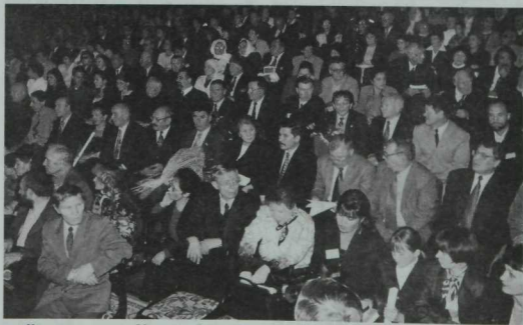
«Казан утлары»ның 80 еллык юбилее утырышынан күренеш. Милли мәдәни үзәк. 2002 ел.