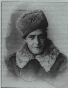
Шагыйрь Гадел Кутуй. 1944 ел.