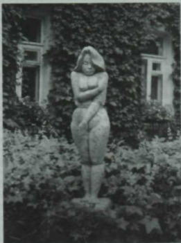
Су анасы (Болгар кызы). 1990. Кадим Жамитев эше.

Эбиемнең сөйләгәне буенча, анын этисе «урта хәллеләр»дән булган. Сөрү жирләре, байтак кына мал-туарлары, атлары... Төннәрнен берендә, чираттагы