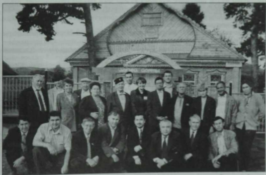
Ризә Фәхрәтдин музеена төрле төбәкләрдән килгән бер төркөм зыялылар. Әхмәт районы, Кичүчат авылы. 2000 ел.