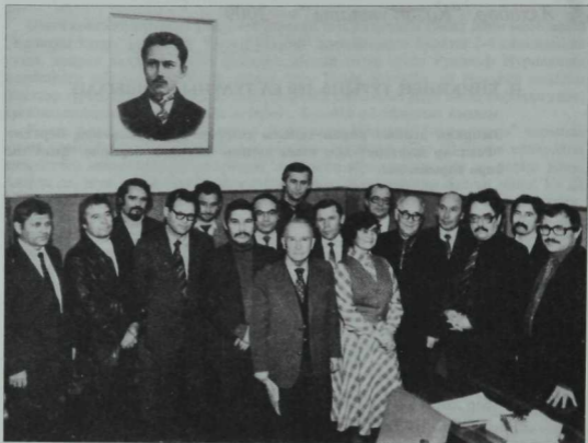
Татарстан Язучыларының X съездында (1984) сайланган идарә әгъзалары.