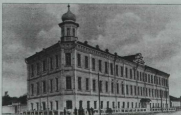
Оренбургтагы "Хөсрөния" мәдрәсәсе. 1902 елгы фото.