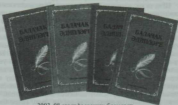
2002–08 елларда чыккан басмалар.

Менә шушы бик тә житди, үтә зарури миссияне бөтен тирәнлеген белән анлап, Татарстанның "Мәгариф" нәшрияты сонгы елларда "Балачак әдипләре" дигән дүрттомлык бастырды. Шуль китапларның кайсысындыр кулга алып укый башлауга ук нәшриятның изге максаты өлкәннәргә генә түгел, мәктәп