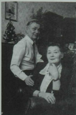
Артистлар гаиләсе. Халык артистлары Исламия Мәхмүтова һәм Хәлил Мәхмүтов. 2000 ел.