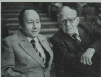
Ике бөек шәхес: сынчы Бакый Урманче (1921–93) һәм композитор Ростәм Яхин (1987–93), 1981 елда төшерелгән фото.