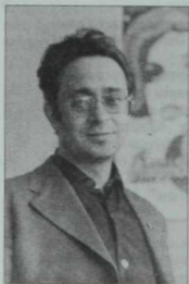
Шагыйрь Марк Зарецкий. 1970 ел.