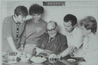
Казахстанда яшәүче татар язучысы Ибраһим Салахов Казандагы яшь журналистлар арасында. 1994.