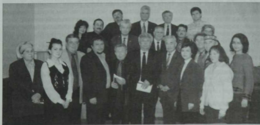
Казаннан килгән иши язучылар Уфадагы каламдәңселәре янында. 2005 ел.