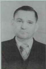
Шагыйрь Рәшит Гәрәй. (1931—1999).