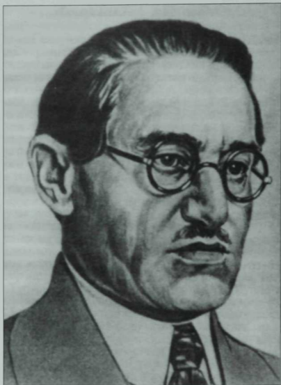
Шәриф Камал (1884—1942)