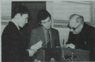
Әмирхан Еники укучылары белән.

Мостафиннын беренче һәм икенче хатыны Мәрьям белән Наһия, Мәрьямнен әнисе белән Майпәрвәз капма-каршы куела. Шул ук үзәнчәлеккә «Рәшә» повестенда да юлыгабыз. Әсәрнен төп герое Зөфәр бертуган абыйсы Зариф белән чагыштырылса, төп геройны ачу өчен Рәшидә һәм Гамбәр образлары капма-каршы куела. Сюжет корылышындагы параллельлек принцибы Ә. Еникинен «Йөрәк сере» повестенда аеруча ачык күренә.