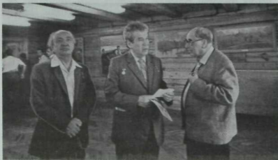
Татар һәм башкорт мәдәниятеннән күренекле әһелләре (уңнан сулга) Әмирхан Еники, Мостай Кәрим, Нәҗип Җиһанов.

Анын әсәрләреннән гажәеп дәрәжәдәгә фәлсафи тирәнлегә, әдәби-эстетик яктан үтә камиллегә, аларда милли рухнын һәм милли психологиянен гаять нечкә һәм матур чагылышы, тормыш күренешләреннән бик тө масштаблылары һәм типиклары сайлап алыну һәм тасвирлану, әсәрләреннән халык моннарына якын дәрәжәдә музыкаль янгырашы һәм әдәбият-сәнгать әсәрләре өчен хәлиткеч кимәлдә мөһим булган тагын башка асыл сыйфатлар безгә Әмирхан Еники ижатына әнә шундый ин югары бәһане кую мөмкинлегә бирә.