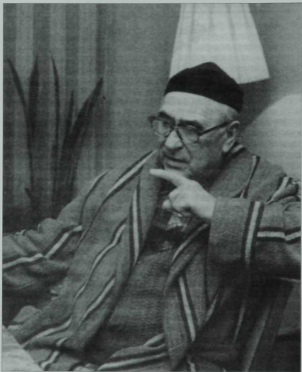
Эмирхан Еники (1909–2000)