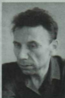
Әнвәр Давыдов (1919—1968)