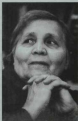
Балалар язучысы Әминә Биккәнтәева (1913—1986).