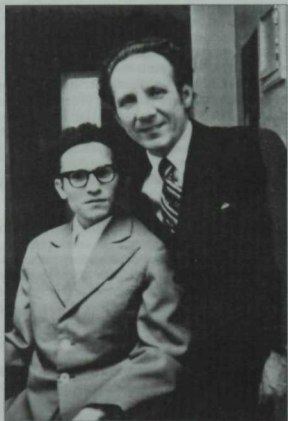
Шагыйрь Фәнис Ярүллин һәм режиссер Равил Тумашев. "Әнә килә автомобиль" спектаклендән соң төшерелгән фото, 1975 ел.