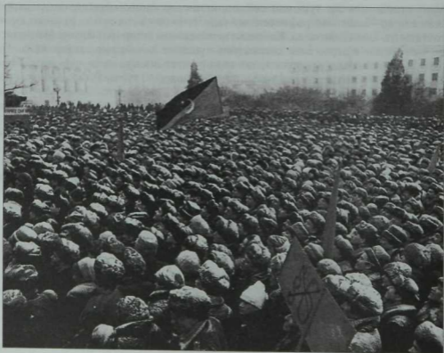
Татарстан суверинететы өчен көрәш еллары. Казан. Азатлык майданы. 1991 ел.