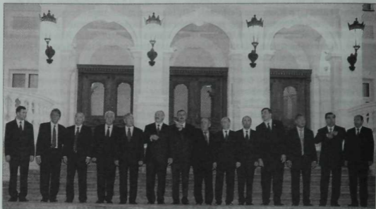
БДБ илләре җитәкчеләренең Казанда уткан саммиты. Казанның 1000 еллыгын бәйрәм иткән көннәр. Август 2005 ел.