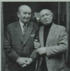
Композитор Нәҗип Җиһанов белән. 1980 еллар.