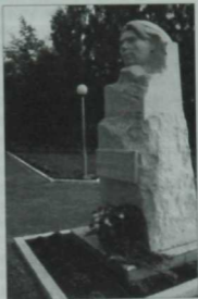
Шагыйрьгә Дүртөйләдә (Башкортстан) куелган һәйкәл.

Синен «Казанны алу»ны төшереп (Казан) калдырганнар. Минем хактагы синен иң зур сүзен шул. Аннан соң «Татар теле»н дусларын югалта-югалта язды»,—дип әйтүен дә зур хакыйкаты.