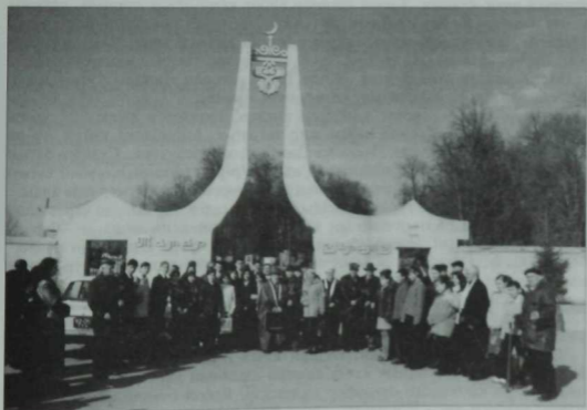
Казанның Яңа Бистәдәге татар базары. Тукайның үлеменә 90 ел тулган көн. 2003 ел.