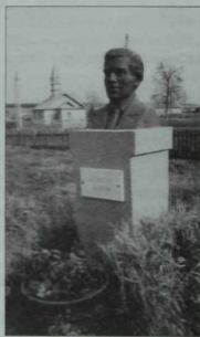
Туган авылы Коекто (Спасс районы), шагыйрь Абдулла Алиш бюсты.