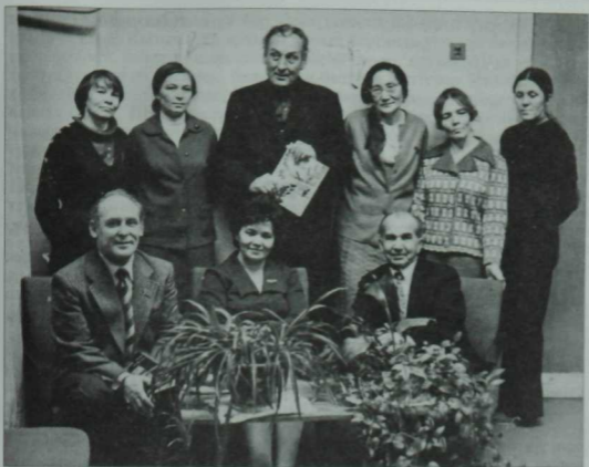
СССРның халык артистлары Шәүкәт Биктимиров (сулда), Азат Аббасов (уртада) һәм Фуат Халитов «Азат хатын» (хәзерге «Свебник») журналы редакциясендә кунакта. 1977 ел.