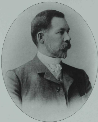
Дәрдемәнднең тууына 150 ел (1859-1921)