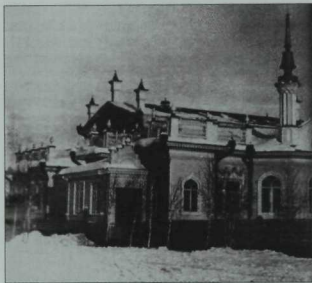
Жәйләрен Рәмиевләр гаиләләре белән Оренбургтан китеп, приискалары янындагы шушындый йортларда уздырганнар. Аларның мондый йортлары хәзерге Башкортстанның Күсәй авылы янында да булган.

«Иттифакъ...» партиясен оештыруда катнашучылар, патша түрәләре тарафыннан эзәрлекләнүенә дә карамастан, бу эштән читләшмиләр. Дәрдемәнд тә бу партияне оештыру өчен яшерен рәвештә 1906 елның гыйнварында Санкт-Петербургта уздырылган корылтайда катнаша. Мона чаклы инде ул кадетлар партиясенен Оренбург губернасындагы бюросына кертгән була.