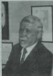
Рәссам Эрот Зарипов (1938—2009).