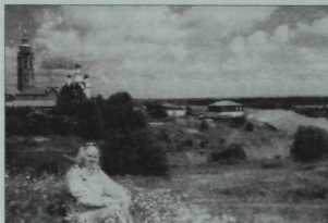
Ф. Бәйрәмова элек Чөрдән Кремле булган эсирдә