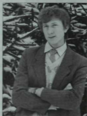
Лондонда яшәүче татар шагыйре Ростәм Сүати.