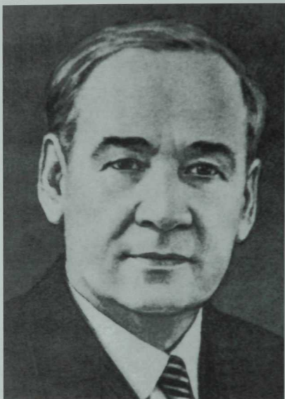
Нэкий Исэбэт (1899–1992)