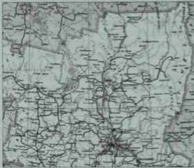
Чәрдән төбәге Пермь өлкәсенәң иң төньягында

Чаллыдан Пермьгә автобус белән ун сәгатълек юл, Пермьнән Чәрдәнгә исә тагы алты сәгатълек сәфәр икән. Юл гел урман эчләреннән бара, ара-тирә каршыга Кама елгасы киләп чыга, Чәрдәнгә житәрәк башка зур төньяк елгалары да очрый башлый. Элек безнең бабайлар бу юлны су белән айлар буге үткәннәр, бу турыда