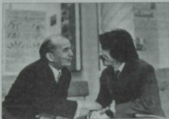
СССРның халык артисты Фуат Халитов һәм язучы Әхәт Гаффар.