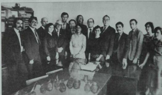
«Казан утлары» журналында «Почет ордены» тапшырылган көн истәлеге. 1982 ел.