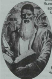
Без—Кол Галиле, «Йосыф-Золәйха»лы халык.

Татар тарихы һәм аның бүгенге язмышы өчен янып-көеп йөрүче милләттәшебез, дипломат һәм галим Йолдыз Халиуллин «Независимая газета» ның 2009 елның 6 октябрендә Эдурд Паркерга багышлап чыгарган мәкалә шулай ук бик кызыклы һәм зур әһәмияткә ия.