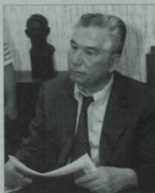
Кыргыз һәм татар халыкларының боек улы Чыңгыз Айтматов Казанда еш була иде. 2001 ел.