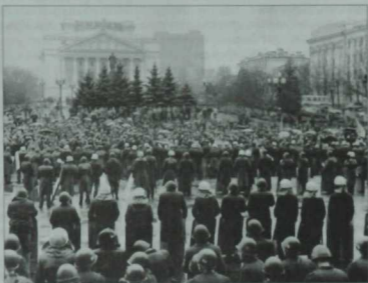
Азатлык майданы азатлык даулы. 1991 ел.

19 августта яңартылган Союз договорын имзаларга процесс башланарга тиеш иде. Тик менә делегация Мәскәудән кайтып өч көн үтү белән үк ГКЧП фетнәсе купты. Аны СССР Президентны М. С. Горбачевның иң якын яраннары башлады. Горбачев исә, ил белән идарә итү дилбегәсен куллары калтырап торган Янаевларга тапшырып, Кырымга, Форостагы дачасына ялга китеп барды. Гекачепистлар жиңделеп, кулга алынганнан соң Горбачевның базары төште. Ул хәлсезләнгән, көчсез, мөскен бер бәндәне хәтәрләтә иде. Аның болай да бик ныклы булмаган сәясә иختяры бөтенләй юкка чыккан. Шуннан файдаланып Россия, Украина,