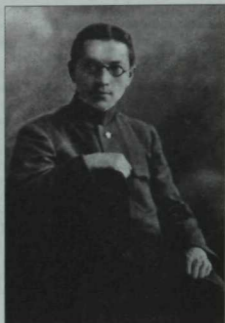
Чагыштырмача аз мәғълүм, әмма татар халкы өчен күп изге гамәлләр кылган галим, сәясәтче Галимҗан Шәрәф. Узган гасырның 20нче еллар фотосы.