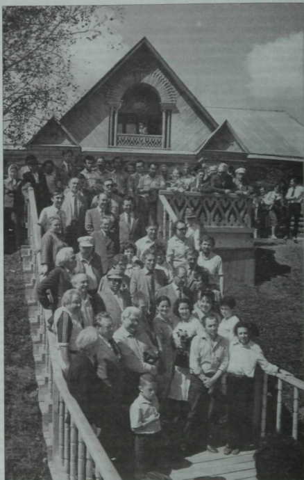
Габдулла Тукайның тууына 100 ел тулган көндә төшерелгән фото. Игътибар белән караганда бу рәсемдә дистәләгән мәңгүр шәхесләрне танып була. Кырлай авылындагы Тукай музейе эргәсендә. 1986 ел.