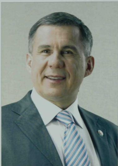
Татарстан Республикасы Президенты Рөстәм Нургали улы МИҢНЕХАНОВ