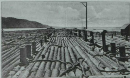
Заманында Идел буйлап шундый саллар аккан.