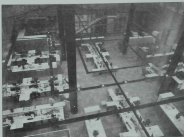
«Азатлык» радиосы бинасының эчке яктан күренеше.

рақ итеп бу бұлмәне мин радио техникасы тутырылган «радио-аквариум» дип атар идем.