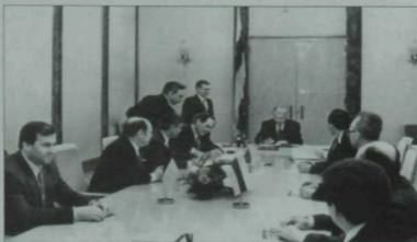
Шартнамәгә күл кую вакыты.

дистәләгән спорт һәм культура объектлары үсеп чыкты, Кама аша күпер салынды. Башкалабызда метро барлыкка килде. Якын киләчәктә нефть эшкәртү нык артыр. Шушы елларда барлыкка килчәк заводлар 14 миллион тонна чимал эшкәртә алачаклар. Республика нефть белән генә түгел, күбесенчә аның продуктлары белән сөүдә итәчәк. Бу исә