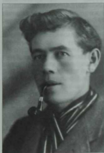
Шагыйрь, прозаик, драматург Әхмәт Фәйли. Үткән гасырның 30чы еллары.