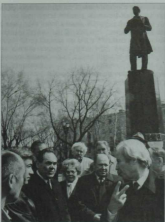
Республика жетокчеларе язучылар белен берге. Шигырь бэйраме. 1996 ел.