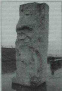
Маутхаузенда Д. Карбышев һәйкәле.

Маутхаузен хәрби әсирләр өчен, соңрак «түбән» милләтләр өчен лагерь буларак калкулык өстендә тезелгән. Тоташ стена, чәнечкеле тимер чыбык, күзәтү манаралары, бараклар, биек торбалы крематорий... Күршесендә—ташлык. Таш ваттыру өчен, лагерьны менә шушында салганнар да инде. Тоткыннар шунда иртән 6 дан караңгыга кадәр эшләнә. Иртән аларга өйрә ашатканнар, төшкә шуңа ит кисегә салынган. Кайчакта көрпә кушып ясалган сосиска, бөйрәмнәрдә мармелад бирелгән... Крематорий торбасы озак төтенләп тормаган... Тирә-юньдә яшәүче халык сасы истән зарлана башлаган. Тик аңа карап кына үлем фабрикасының эше кимемәгән. Маутхаузенда 122 мең кеше җазалап үтерелгән. Алар арасында ммилләттәшәбез, инженерлык гаскәрләре генерал-лейтенанты Дмитрий Михайлович Карбышев та булган. Ул лагерьларда дошманга каршы яшерен эш