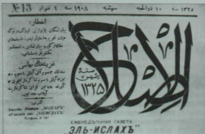
Тукай яшәгән «Болгар» номерларында (2008 елның көзәндә әҗмәрәп вәйран иттеләр) нәшер ителгән «Әл-ислах» газетасының титул бите.