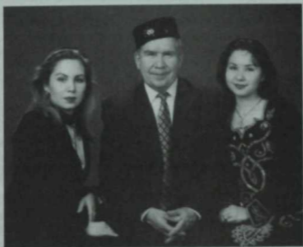
Танылган жырчы Шамиля Әхмәтжанов кызлары Гөлнар һәм Чулпан бәлән. 2005 ел.