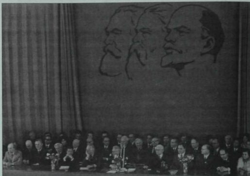
Татарстан язучыларының VIII съезды президиумы. Жентеклэн караганда байтак таныш ийәзләрне күрергә мөмкин. Казан, 1974 ел.