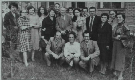
Быел күрәнекле режиссер һәм педагог Ширияздан Сарымсаковның тууына 100 ел тулды. Ш.Сарымсаков (уртада) Казан мәдәният институты (хәзерге Казан мәдәният һәм сәнгать академиясе) студентлары һәм хезмәткәрләре белән. 1984 ел.