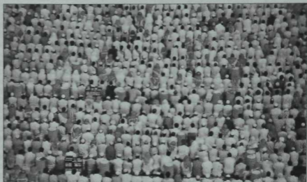
Бу айда Корбан гаете бәйрәме булып узды. Хаж кылучылар намазда. Мәккә шәһәре.