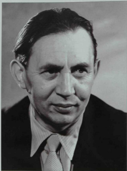
Габдрахман Әпсәләмов (1911—1979)