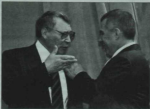
Президент Рөстәм Миңнеханов съездда Рәдиф Гаташқа «Татарстанның халык шигъиры» дигән мактаулы исемнең билгесен тапшыра.

Ак көгәзьгә мөгҗиза чыганагы итеп карый белгән Ренат Харис әлеге юлларны үзенең һәрбер буындашы исемненән белдерә кебек тоела. Чыннан да, милли әдәбиятыбыз тарихына атаклы «алтмышынчы елгылар» буларак кәргән әлеге плеяда вәкилләре татар шигъриятенен иксез-чиксез тирәнлегеннән талант көче белән нинди генә жәүһәрләр чыгармады икән?! Әйткәнәмчә, алар әлегәчә иярдә. Соңгы елларда Ренат Харис үзе драматургия өлкәсендә бик нәтижәле эшлөп алды, шулай ук шигърьләр, сонетлар, поэмалар һәм кызыклы мәкаләләр язарга да өлгерде. Шулай ук Равил Фәйзуллин да әдәбиятыбызга армый-талмый хезмәт итте: