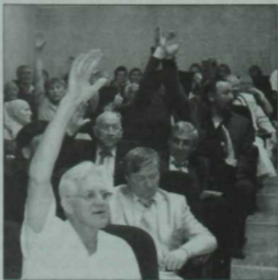
Корылтайдан бер күренеш.

Татарстан язучыларының XVII корылтае язучылар жәмәгәтчелегенен киләчәктәге һәр гамәле, беренчә чиратта, республикабыз тормышын һәрьяклап кайгытырга, туган халкыбызның милли идеясен раслауга һәм үстерүгә хезмәт итәргә тиеш дип