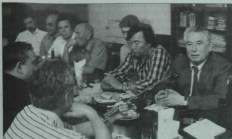
Татарстан Язучылар берлегендә очрашу. Уңнан сулга: Чыңгыз Айтматов, Олжас Сөләйманов, Равил Фәйзуллин, Харрас Әюп, Марат Әмирханов, Солтан Шәмси. 2000 ел.