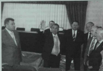
ТР Президенты Р.Н.Миңнеханов Татарстан Язучылар берлегенә яңартылган бинасында. 2012 ел, 18 май.

язучыларыбыз өчен һәм күпчелек әдипләр катнашында 2009, 2010, 2011 — әдәби ел йомгалары кысаларында үткәрелде. Конференциядә ясалган докладлар, чыгышлар аерым жьентыклар булып бастырып чыгарылды һәм алар безнең каләмдәшләребезгә, бигрәк тә яшь язучыларга кулланма булып та хезмәт итәр дип уйлыйбыз. 2008 елда Әлмәттә «Милли драматургиянең бүтүнгәсә һәм киләчәге» дигән темага барлык драматурглар,