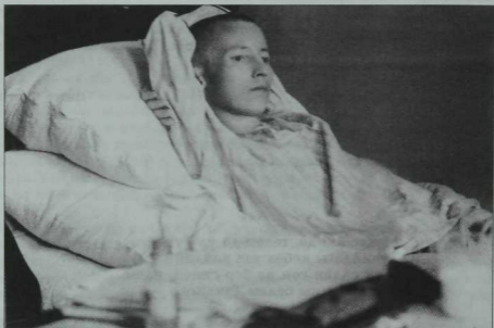
Тукайның вафатына 14 көн кала, 1913 елның 1 апрелдә хастаханәдә төшерелгән иң соңгы ике фоторәсеме.