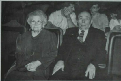
Композитор Әнвәр Бакиров хатыны Фирдәүсә ханым белән. 1997 ел.