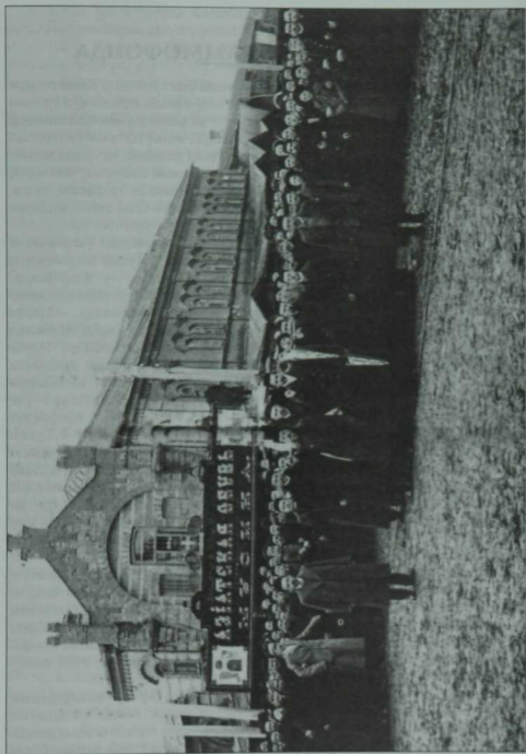
Шәһәрҙең соңғы юлга олату. 1913 елның 17 апрелдә.