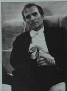
Бөек биюче Рудольф Нуриев (1938 — 1993). 1992 елны Казанга килгәч алынган рәсем.