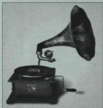
IX — XX гасырларда кулланышта булган граммофон.

Менә шул өйрәнәсе мирасын үзенчәлекле бер өлеше — ул да булса Г.Тукай әсәрләренен шагыйрьнен замандашлары — жырчылар, артистлар тарафыннан граммофон тәлинкаләренә яздырып калдырган фонограммалар. Әйтергә кирәк, Г.Тукайның Уральскидагы чорында ук ижат ителгән беренче шигырьләре газета битләрендә басылып чыгуга халык арасында тарала. Беренче әдәби-музыкаль кичәләрдә яна ижат иткән әсәрләрен шагыйрь үзе укып ишеттерә, аның белән бергә мәдрәсәдә белем алган шәкертләр башкарган Г.Тукай шигырьләрен дә халык тарафыннан бик жылы кабул итә. Шагыйрьнен әсәрләрен беренче татар артистлары сәхнәгә күтәрә, тора-бара аның ижат жимешләре халык арасында популяр булган