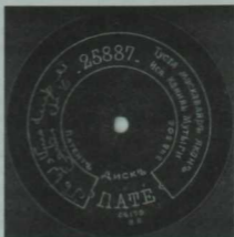
«ПАТЕ» ширкәте чыгарган К.Мотыйсый башкаруындагы «Ай, Дунай» жыры тәлинкасе.