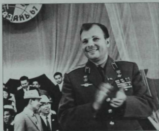
Юрий Гагарин Татарстанда яшьләрнең халыкара «Идел» лагеренда. 1967 ел.