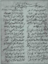
«1764 т» шифрлы кулъязма (Татарстан Милли китапханәсе). 49а кагаз.

Канкый йылдан бу хәбәр улды тамам, Әйдәйем бән тарихыны вәс-саям. Йиде йөз сиксән дүртендә һәмәм, Йарлыкасун Хәллыкыль-әнам. Түрт йөз йесерме бәйт бән дидүм, Мөхәррәм айында вә итмам әйләдүм. Шөкрә Аллаһ кем, кыйлдук бу дәфтәри, Вир салават — шад кыйл фиғамбәри.