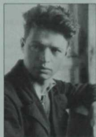
Композитор Фәрит Ярүллин. Мәскәу консерваториясе студенты. 1933 ел.