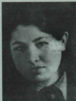
Казанга килеп, университетка укырга көргәч, 1943 ел.