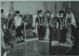
Музейда Кырым татарлары киёмнә киендерелгән курчаклар

Экспонатлар күп тә ул, тик урын гына бәләкәйрәк дип уфтанды хезмәткәрләр. Алар янарак кына оешып экспонатлар жыя башлаганнар икән. Тәҗрибәләре дә азрак. Тоташ бер халык өчен шушындый гына музей тоту минем күнеләмә авыр тәэсир итте. Безнен Эстәрлебаш районындагы Янгырчы һәм Тәтер-Арыслан мәктәп музейлары баерак та, яхшы биналарда да урнашканнар. Музей эшмәкәрләре белән бик төмлөп сөйләшә-сөйләшә чәй эчеп, жылы гына хушлашып аерылышабыз.