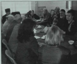
Милли мәжлес утырышы бара

Һәм барысына да сонгы чорда Россия паспортлары таратып чыктылар. Шуларга таянып бөлөкәй генә революция ясап Кырымны янадан Россияга кушарга уйлаган иде дә, барып чыкмады. Чөнки монда әле без татарлар бар. Нигә, Абхазияне, Көнъяк Осетияне Грузиядан аерып алмадымыни? Алды. Ә Казакъстан алдан күрөп уйлый белә, башкаласын күчердә дә куйды. Нигә, Алма-Ата алама идемени? Юк, әлбөттә. Барлы-юклы сәбәпләр табып, Астанага күчтеләр. Чөнки тегендә урыслар житмеш процентка якын иде. Урыс хөкүмәтенен әле һаман да империалистик аппетиты