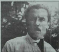
Классик язучы Галимжан Ибраһимовның сирәк фоторәсемнәренә берсе. Үткән гасырның 30нчы еллары.