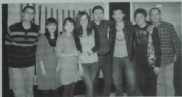
Пекиндагы татар яшьләре. 2013