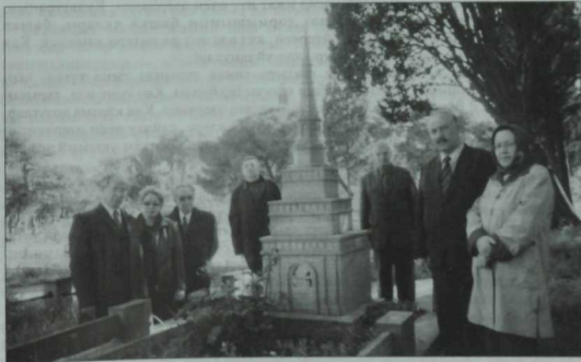
Татарстаннан килгән бер төркем галимнәр Йосыф Акмура кабере янәшесендә. Истанбул. 2005 ел.