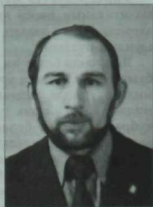
Равил Рахмани (1949) әдәбият галиме һәм шагыйрь.