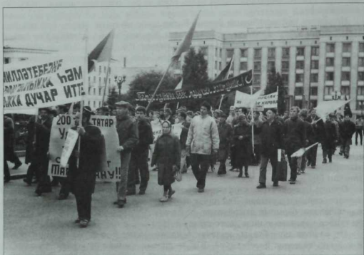
Һәр елны 15 октябрьдә Казанда Хәтер көне үткәрелә. Ул Ирек майданында башланып, Соембикә манарасы янында җәназа намазы уку белән төгәлләнә.