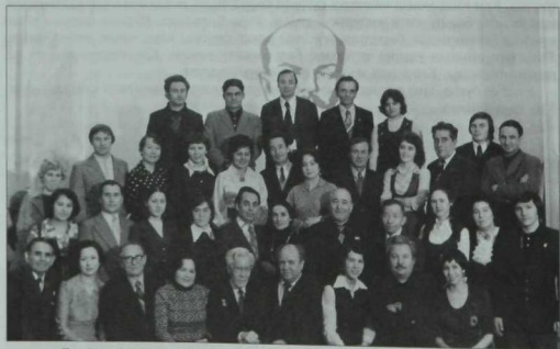
Тухай клубында Камал театры артистлары белән очрашу ядкәре. 1977 ел.