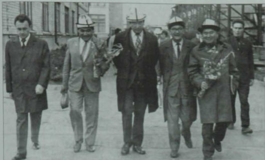
Татарстанда Кыргызстан ооэбияты кoннaрe. Кунаклaр рeспубликанын тoзeлeш oбьeктлaрынa. Уртaдa – Чынгыз Айтмaтoв, 1972 eл.