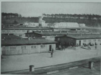
Виноград тавы лагере. 1915 ел, май.

Алман әсирлегенә төшкән татарларның санын атау тагын да авыррак, төгәл статистик саннар сакланмаган. Ләкин татарларның Алмания территориясендә кимендә 100 әсирләр лагеренда искә алынуы бу сан аз булмаган дип фаразларга