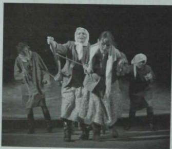
«Арбалы хатыннар» (З.Зәйнуллин) спектакленән күренеш. 2010 ел.

шул вакытта — 1926 елда — мәйданга К.Тинчурин белән С.Сәйдәшев ижат иткән «Зәңгәр шәл» спектакле чыга. Татар кешесенә янадан чабата кидертеп, үзезбечә, безнен милләтебезгә генә хас сыйфатларны үз эченә алган, менә шушундый формадагы театрға нигез салынган. Ике талантлы кеше очрашкан... Алар, әлбәттә, аңлаганнар: совет заманында милләтне саклап калыр өчен, халыкка якын булу кирәк, бары тик халык белән тыгыз элемәдә генә татар театры, татар мәданияте, милли үзәңбыз үсешкә ирешчәк. Без аларга рәхмәтле булырга тиеш, чөнки ул заманда театр төрки культура юлынан китсә,