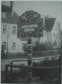
Цоссен шәһәрендә татар әсирләре эшләгән урам күрсәткече.

Әсирләргә азык-төлек белән тәмин итү башка лагерьлар белән чагыштырганда яхшырак булган, мәсәлән, көненә һәрбер әсиргә 300 грамм икмәк бүлеп бирелгән.