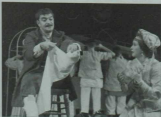
«Банкрот» (Г.Камал) спектакленнән күренеш. 2013 ел.

Димәк, бу кешеләр битараф түгел, менә бөтенләй дәшмәсәләр, бернәрсә язмасалар, анысы инде куркыныч. Шуна күрә бүген тәнкыйтьне бик тыныч кабул итәм.