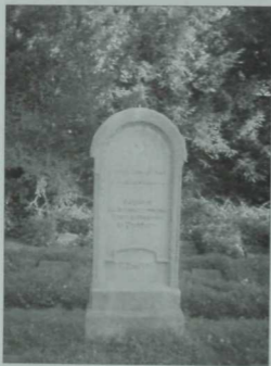
Пушайм шәһәре зиратында татар әсирләре истәләгенә куелган кабер ташы (бүгенге күренеше).

Төрле эшләрдә катнашып, татар әсирләре, күрәсен, алманнарда бик унай тәәсир калдырган — лагерь офицерлары да, фермерлар да аларнын тырышлыкларын югары бәйләп торган. Балки шул нигездә, инде 1917 ел башында кайбер рәсми вәкилләрдә хәтта шундый бер фантастик план да барлыкка килгән: 200-300 әсирне азат итеп, алман жирендә «татар колониясе» оештырып жиберергә. Бу колония үзенә күрә