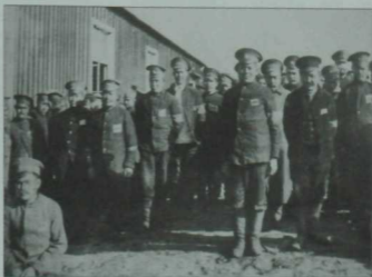
Лагерьдагы татар хәрби әсирләре, 1915 ел.

Әсирләр бу лагерьларда жылытылган агач баракларда тотылган, үз униформалары булган. Лагерь эчендә барлык әсирләр аерым батальоннарга бүленгән, батальон башында алман офицерлары торган. Алар, әлбәттә, татар телен белмәгән, шуна