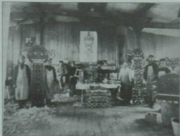
Виноград тавы лагеренда агач эшкәртү остаханәсе.

Ләкин кулыннан эш килгән әсирләр өчен лагерьның үзәндә дә шактый үзәнчәлекле шартлар тудырылган, төрле остаханәләрдә әсирләр