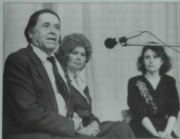
Академик Әбрар Коримуллин бетон очрашу кичәсе.