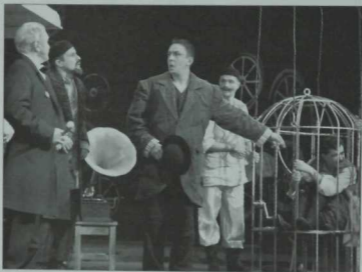
«Банкрот» (Г.Камал) спектакленнән күренеш. 2013 ел.

— Канәгатьләндерә бит әле. «Мунча ташы»на билетлар юк, Буа театры килсә дә, билетлар юк. Димәк, канәгатьләндерә. «Банкрот» артыннан театр «Хужа