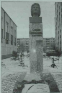
Әлмәттә шагыйрә Сажида Сөләймәновнага куелган бюст-һәйкәл.