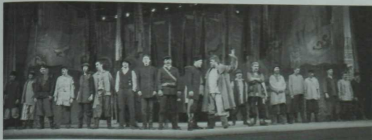
«Зәңгәр шәл» (К.Тинчурин) спектаклендә күренеш. 2011 ел.

гасыр башындагы жәдитчеләребез үрнәк булып тора. Алар милләтебезне күтәргә тырышкан, алга барырга өндәгән. Хәзер миллелик артына яшеренәләр, үзләре милләт өчен берни эшләмиләр. Артка гына тарталар. Имеш: «Ничек инде сез чит ил классикасын куясыз, начар булсын, әмма үзебезнеке булсын». Халкыбызны белемле итәргә тырышып, мәдрәсәләребезне үзгәртеп, күпме көршкән ул шәхесләр гасыр башында. Шәкертләр күтәрелгән. Тукайлар, Фатих Әмирханнар, Гаяз Исхакыйлар... Ә хәзер янадан кирегә әйләнеп кайтабыз.