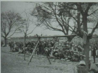
Мөселман әсирләрө Корбан гаестен бөйрәм итә. 1915 ел, 20 октябрь

алман газеталары да азып чыккан — 1920 елда «Дойче алльгемайне цайтунг», мәсәлән, түбәндәге фикерне китергән: «Корьән күрсәтмәләре буенча беркем дә мәчетне жиимергә хаклы түгел. Алманиядә яшәүче татарлар һәм мөселманнар өчен ул изге урын булып кала, һәм Алмания аны шулай кабул итәргә тиеш. Алман хөкүмәтенен әхлакый бурычы — барлык кызыксынган татарларга үз дини мәнфәгатьләрен канәгатьләндерергә мөмкинлек бирү».