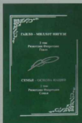
Ризатдин Фәхрәтдин. ГАИЛӘ. – II том. – «Отечество» нәширияты, 2013. – 238 б.

Танылган мәгърифәтче Г.Бубыйның «Хатыннар» исемле тирән мәгънәле бу фәлсәфи әсәре XX гасыр башы татар жәмгыятендә төп урынны алып торган мәсьәлә – хатын-кызның гайлә һәм жәмгыятьтәге хәлен тасвирлауга багышланган. Милләтебезнең зыялы заты гайләнең әхлакый нигезләре, тәрбия һәм белем бирүнең бер-берсеннән аерылгысызлыгы хақында уйлана, гайләнең һәм жәмгыятьнең бөтенлегендә хатын-кызның ролен ачык күрсәтә. Китапның фәнни мөхәррире – социология фәннәре докторы Ф.Ә.Илдарханова. Текстны эшкәртүче һәм тәржемә итүче – тарих фәннәре кандидаты А.Х.Мәхмүтова