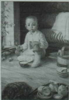
«Баләкәй Тукай». Рәссамы — Х.Казакөв

Тынгы белмәс яшь рәссам күпне күрергә, күп белергә, «язарына азык эзләп», күп жирләрдә булырга өлгергән. Андагы бай тормышны күпсанлы әсәрләрендә чагылдырган. Ул 1950-1952 елларда Кыргызстаннын Фрунзе шәһәрәндә, 1952-1954 елларда Баулы, Бөгөлмә, Әлмәт кебек нефть районнарында яшәп, бай тормыш тәжрибәсе туپмый. Әгәрәнки гомер буена жыелган ижат жимешләреннән күргәзмә оештыра башласан, алар зур залга да сыеп бетмәс иде. Быел, бер гасырлык юбилей