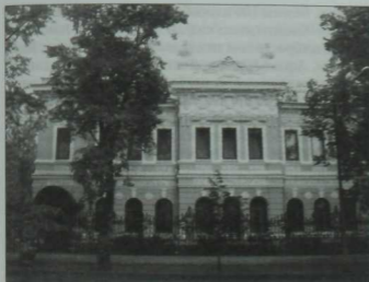
ТР Язучылар берлеге бинасы

Төрле төбәкләрдә туган язучылар ижатына багышланган фәнни укуларда, «түтәрәк остал» сөйләшүләрендә катнашабыз. Ижатка сәләтле балалар арасында республика конкурслары үткәрелә. Болар барысы да, бердән, туган телгә мөхәббәт тәрбияләү буенча игелекле эш булса, икенчедән, яшь әдәби алмаш хәзерләү чарасы да.