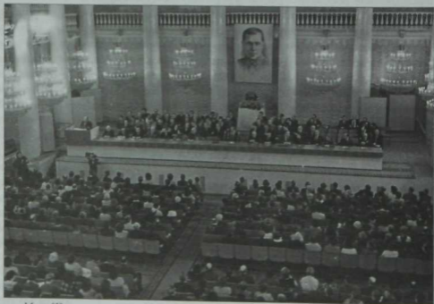
Муса Жәлилнең тууына 80 ел тулуга багышланган тантанадан бер күрешеш. Мәскәу. Колонналы зал. 1986 ел.

«Казан утлары» журналы (элеккеге «Совет әдәбияты») 70 елдан артык Татарстан Язучылар союзы органы булып саналды. Ул хәзер дә язучыларыбызның төп журналы булуын дәвам итә.