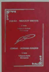
Габдулла Бубый. ХАТЫННАР. – I том. – «Отечество» нәширияты, 2013. – 356 б.