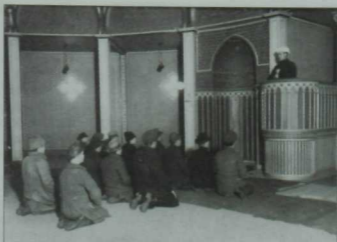
Вюнсдорф мәчетенең эчке күренеше. Мөнбәрдә — Галимжан Идриси

вакыт атаклы «Хөсәения» мәдрәсәсендә шәкертләргә дәрес биргән. Бу шәхеснен «күпкырлылыгы» инде шул чорда ук күренә башлаган — мәсәлән, татар вакытлы матбугатында анын каләме астыннан чыккан күпсанлы мәкаләләрендә ул нинди генә мәсьәләләргә алынмаган. Дин, мәдәният, сәясәт темалары гына кызыксындырмаган аны, ул хәтта авыл хужалыгы яки машиналар төзү турында да мәкаләләр авторы була яки «Шура» журналы битләрендә «Без ни өчен унагай» яки «Наполеон мөселман булганмы?» дигән мәкаләләр дә бастыра.