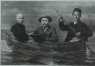
Сулдан уңға: Г.Тукай, С.Рәмиев, Ш.Гайфи. Эстерхан, 1911 ел

дә «Мөхәммәдия» китабының йогынтысы ачык сизелә. «Аның вәзеннәренән байтагы, — ди ул, — «Мөхәммәдия»дәгечә улдыгы кебек, ифадә вә тәркибләрдә, өслүбтә, тәгъбиратнын бик күбәндә, хәтта гыйшык вә шикаять хакында булган шигырьләренән мәгънә вә мәфһүмнәрендә дә жәнәбе Калибули хәзрәтләренән күлгәсә бик ачык төшәп тормактадыр».