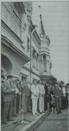
Казанда Габдулла Тукай музейе ачылу күрешеш. 1986 ел.