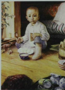
«Баләкәй Тукай». Хажиморат Казаков рәсеме