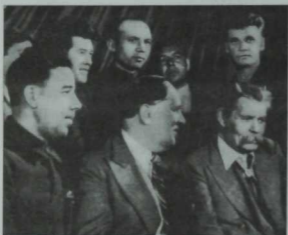
СССР язучыларының I съезды делегатлары; беренче рәттә (сулдан уңга): Кави Нәҗми, Алексей Толстой, Максим Горький; икенче рәттә: Хәсән Туфан, Гомәр Толымбай, Фатих Сөйфи-Казанлы, Галимҗан Нигъмәти. Август, 1934 ел.

Бауман урамында урнашкан атаклы Матбугат йорты. Уткән гасырның утызынчы еллар уртасыннан сиксәненче еллар уртасына кадәр бу бинада Татарстан Язучылар оешмасы урнашкан иде.