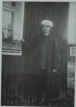
Галимжан Идриси. 1920 ел