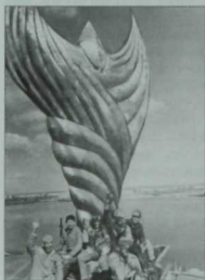
Казансу ярында, Милли-мәдәни үзәк янындагы «Хоррият» сынын урнаштыру вакытында төшерелгән фото. 1996 ел.