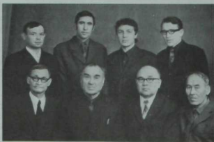
Татарстан Язучылар берлеге карамагында эшләп килгән чуаши язучылары секцияясе агъзалары. 1973 ел.