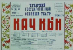
Нəжип Жиġановның «Качкын» операсы спектакленең премьерә афишасы. 1939 ел.

«Көтмэгәндә Литинский, торып: «Татар операсы булчак, аны Нəжип Жиġанов язчак, ә либретто авторы — Әхмәт Фəйзи», — дип әйтеп салды һәм, миңа иелеп: «Язам дип әйт», — дип пышылдады. Миң көтелмөгөн бу яңалыктан дулкынланып, куркып кына: «Әйе, опера булчак», — дип җавап бирдем», — дип искә ала Жиġанов...»