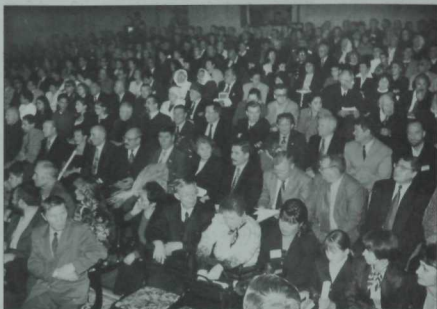
«Казан утлары» журналына 80 ел тулу тантанасының зал күренеше. Милли-мәдәни үзәк. 2002 ел.