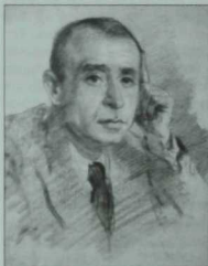
Сибгат Хәким портреты. Байназар Әлмөнов эше. 1950 ел.