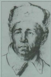
Шагыйрьнен Байназар Әлмәнов тошергән портретының «Казан» милли мәдәният үзәгендәге Милли мәдәният музей фондларында сакланган фотокучермәсе.

«Таныш өянкеләр» ( Татар. кит. нәшр., 1997 ) китабында Гөлшат Зәйнашева Сибгат Хәким белән Зифа Басыйрованың төгәл очрашу урынын ассызыклай – Горький урамы, 15 нче йорт, ягыни радиокомитет янында. Ул әлеге очрашунын шагыйрьнен берничә көнгә Казанга кайткан вакытына туры килүен дә яза. Мәгълүм ки, Сибгат Хәким 1941 елнын июнендә армиягә чакырылып, шул елнын ахырына кадәр запастагы гаскәри берәмлектә хезмәт итә, аннан кыска сроклы хәрби курслар тәмамлап, ул, чыннан да, 1942 елнын кышында Казанга кайта. Байназар Әлмәновнын Татарстан Республикасы милли музей фондларында сакланган шагыйрь портретына да нәкъ менә «Бөек Ватан сугышынан командировкага кайткач тошерелгән» дип аңлатма бирелгән. Ләкин ул вакытта жырнын әле тумаган булуы ихтимал (жырнын 1942 елда язылуы гына билгеле). Сибгат Хәким истәлекләрендә «1942 елнын көзендә Калинин фронтында, Ржев янында, өйдән килгән хаттан белдем», дип конкрет язган икән, бу очракта шагыйрь сүзләренә таянабыз. Хәер,