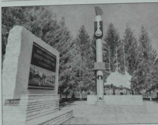
Татарстан нефтен ачучылар истәлегенә.

— әйткәнөбезчә, кара алтын чыгаруының яна ысуллары, алдының технологияләренә сынау һәм куллану, яна техника һәм жиһазлар белән тәҗрибәләр.