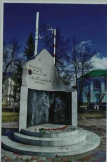
Чернобыльчеләр истәлегенә монумент.