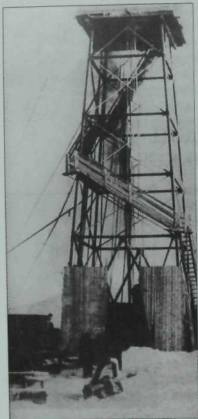
Беренче скважина. Шөгөр, 1943 ел.