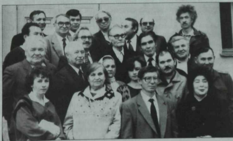
Нефть төбәгендә яшәп иҗат итүче язучылардан бер төркем. 90нчы еллар башы.