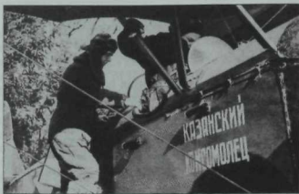
Казанда жыелган У-2 самолёты.

гаскәрдәге йөзләгән самолётның сугышның беренче көнөндә юк ителүен белгәч, округ штабы янындагы мәйданда кызыл флаг төсенә буйланган самолёты канатына басып, үз-үзен шулай атып үтерә. Ләкин ул унышсыз командирларнын андый үлеме генә тиндәшсез яу кырында йөзәр менәрләп кырылган, шәһит киткән гаскәриләр белән бергә үк жир куенына кәргән байтак гади халык үлемен акламый шул. Сугышны тупчы лейтенант буларак башлаган күренекле совет язучысы Юрий Бондарев та «Горячий снег» романында шундый сәләтсез бер командирның, «эмка» машинасы түбәсенә басып, үз-үзен атып үтерү күренешен китерә дә роман геройларынын яу кырында дошман сугышчылары белән сонгы сулышкача көрәшәп үлгәнлекләрен үрнәк итеп күрсәтә. Әлбәттә, кылган гөнәһлары өчен үз-үзен үлемгә «хөкөм иткән» генерал Копец һәм аның үрнәген кабатлаган кайберәүләр чын егетләрчәк юл да сайлый алган булырлар иде. Әйтик, шул ук Копецның үз самолётында томырылып очып менеп, немешнын берәр «Юнкерс»ын кызыл әләм төсендәге лачыны күкрәге белән бәрәп төшереп үлү мөмкинлегә дә, алай эшләрлек осталыгы булмаган очракта дошманның жирдәге гаскәре, танк колонналары өстенә төшәп, каһарманнарча үлү очрагы да бар иде ич. Ә ул, артистларча кыланып үрә катып басып, «менә күрегез, менә ничек мин үземә жәза бирәм» дип, жыелган кешеләр алдында үз-үзенә ата. Яу кырында һич югы бер дошманны юк итеп үлүен күпкә отышлырак бит.