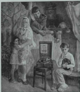
«Эткәм хатирәсе» картинасы.

мышнын син монарчы күрми йөргән бер парчасын күз алдына китереп, күнел кылларына кагылып үтә. Бөтен барлыгын белән останың сурәтләре аша сәяхәт итәсен.