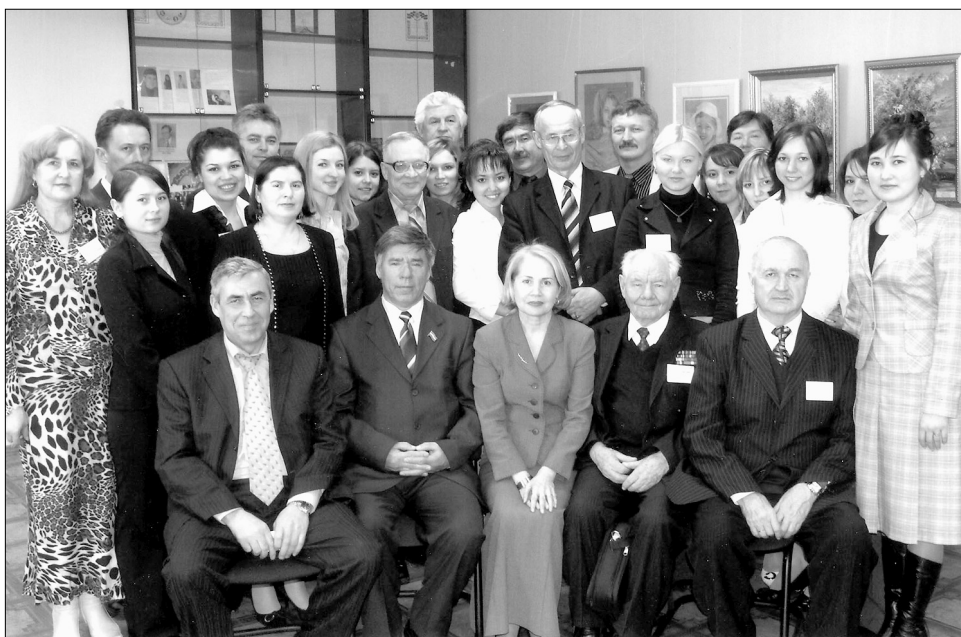
Чаллыда Галимжәсан Ибраһимовның тууына 120 ел тулуга бағышланған фәнни-гамәли конференциядән соң, 2007 ел.