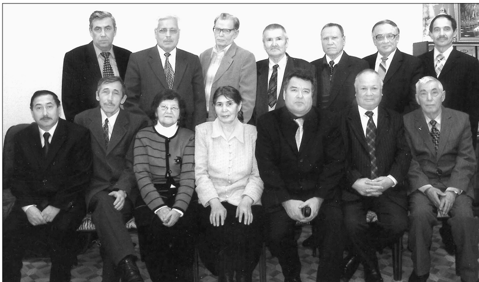
Әдәби ел йомгақларына бағышланған утырыштан соң, 2007 ел.