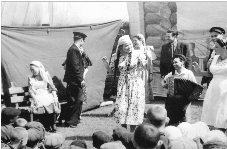
Ә. Фәйзиниң «Акчарлаklar» спектакленнән бер күренеш. 1946 ел.

1946 елдан 1956 елга кадәрле арада авылыбызга килеп куелган спектакльләр Минзәлә театрының батырлыгы, артистларының фидакарьлеге турында сөйли: «Васса Железнова», «Аршин мал алан», «Өйләнү», «Гаепсездән гаеплеләр», «Йөз миллионга елмая», «Мәкер һәм мәхәббәт», «Фамилияләрен әйтмичә», «Сәвил», «Бирнәсез кыз» — болары башка телләрдән тәржемә ителгән әсәрләр буенча куелган спектакльләр генә; арада татар язучыларының пьесалары буенча куелган спектакльләр күпме! Шуңа спектакльләр, аларда уйнаган артистлар йогынтысында бездә — авыл малайларында театр сәнгатенә мәхәббәт уянгандыр дип әйтәбез икән, бу ихластан.