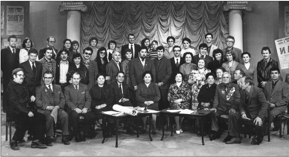
Театрның 50 еллыгы уңаеннан телетапшыруга чакырылган кунаклар һәм театр коллективы. 1985 ел.