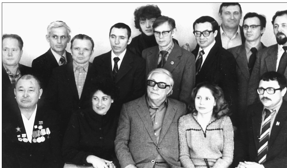
Чаллы язучылары янына кунаклар килгән. Казаннан – Зәки Нури (алдагы рәттә сулдан беренче), Лев Ошанин (уртада). Игътибар белән караганда, фоторәсемдә Чаллы төбәгендә яшәгән байтак әдипләрне танырга мөмкин. 1983 ел.