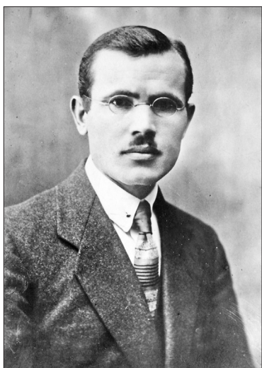
Сəгыйть Сүнчәләй (1889-1937) – шагыйрь, дәүләт һәм җәмәгать эшлеклесе. Татар язучылары арасында С.Сүнчәләй беренче саяси корбаннардан санала.