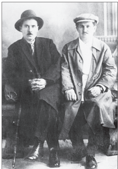
Классик язучы Галимҗан Ибраһимов һәм ТАССР халык мәгарифе комиссары Шәһит Әхмәдиев. 1928 ел.