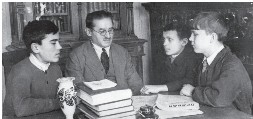
Татар әдәбияты классыгы Шәриф Камал эш кабинетында укучы балаларны кабул итә. Быел, 80 еллап вакыт үткәч, әдип яшәгән йорт Татар китабы йорты дип игълан ителде. 1939 елны төшерелгән фото.