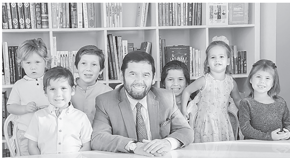
«Иман һәм гаилә – тормыш нигезе» – Шәңгәрәевләр нәселенең төп шигаре.

Ассоциация традицион мәдәният нигезләрен үзләштерү, халыкның гореф-гадәтләренә кушылу, милли һәм рухи-дини бәйрәмнәрдә катнашуны максат итеп куя. Мин моңа акчалар тотам. Аны меценатлык дип атарга да була. Үзем исә моны халкым алдындагы бурычым дип саныйм.