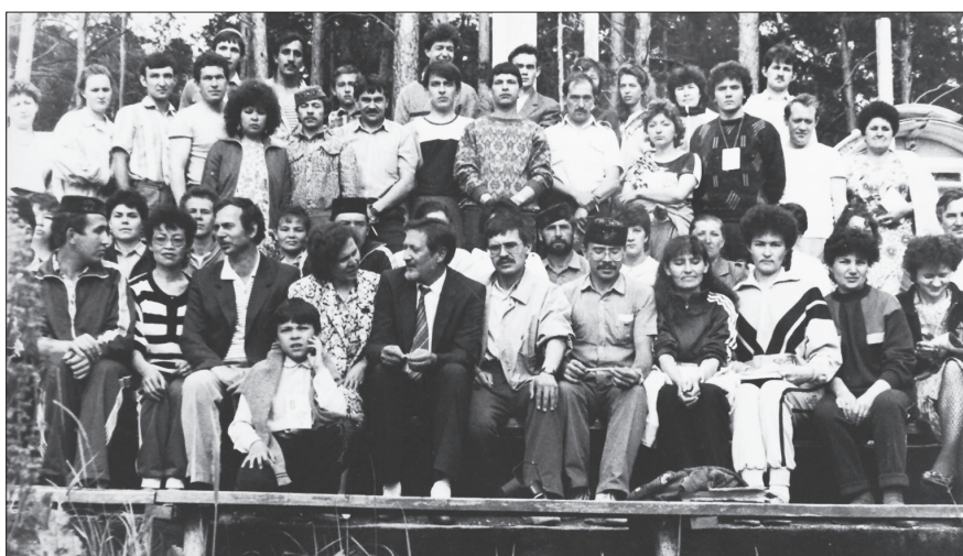
«Идел» халыкара яшьләр лагеренда татар яшьләре көннәре «Идел» журналының шефлык ярдәме белән үтә. 1990 ел, июнь.