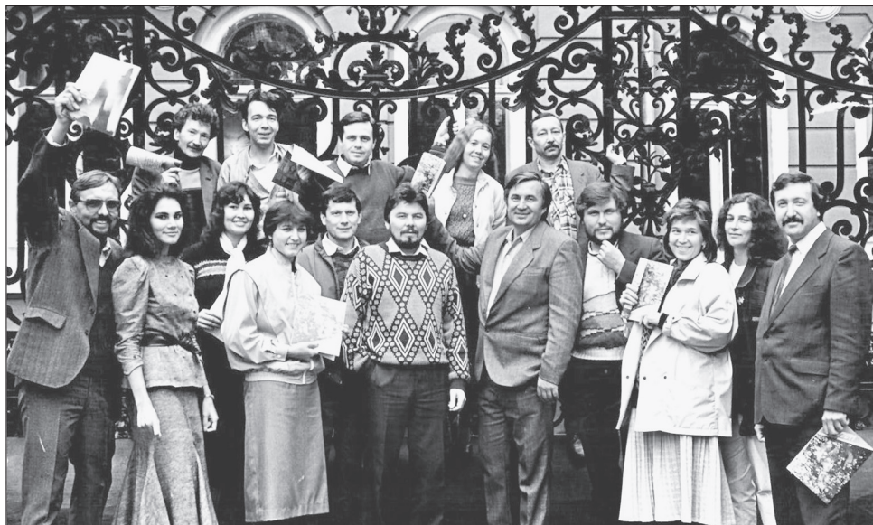
Язучылар берлеге ихатасында «Идел» редакциясе. Журналның беренче саны чыгу уңаеннан төшерелгән фото. 1989 ел, июль.