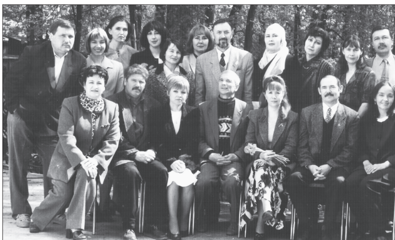
Редакция коллективы бакчада. 2000 нче ел тирәсе.