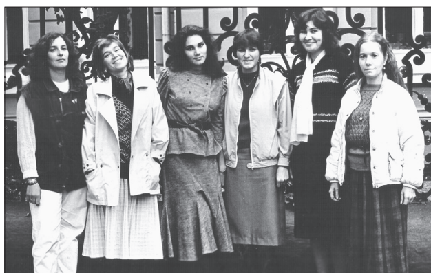
«Идел» кызлары. 1989 ел.