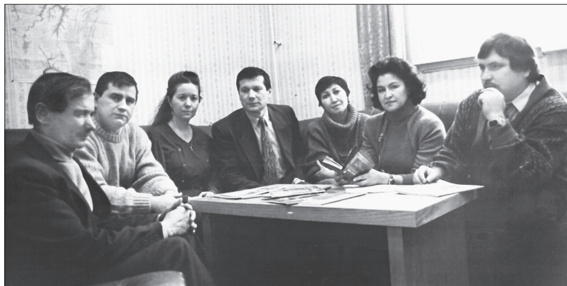
Редколлегия утырышы. 1996 ел, февраль.