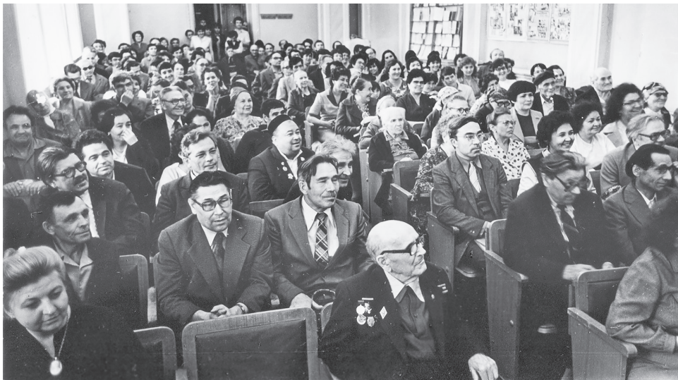
Г.Тукай исемендәге клубта язучылар жыйылышы. 1985 ел.