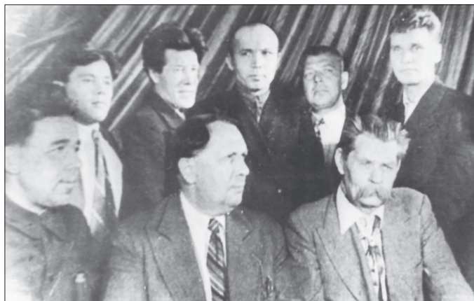
Совет язучыларының I Бөтенсоюз съездында катнашучылар. Беренче рәттә (сулдан уңга): Кави Нәжми, Алексей Толстой, Максим Горький; икенче рәттә: Ләбиб Гыйльми, Хәсән Туфан, Гомәр Толымбай, Фатих Сәйфи-Казанлы, Галимҗан Нигъмәти.