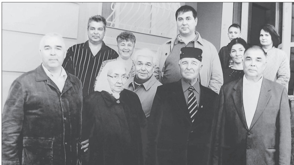
«Без әтиле йортка кайтабыз»...

Ә чынлыкта, мәхәббәтен очратмаса, чак үлемнән калган, умыртка баганасы каты жәрәхәтләнгән, сугыш дигән афәт тәнне генә түгел, жаннарны имгәткәннен үз йөрөгә аша кичергән егет исән кала алган булып иде микән?