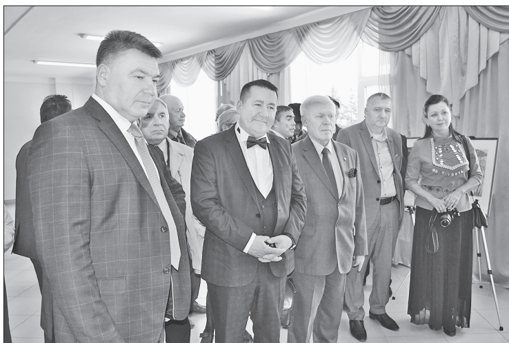
Тукабызның туган ягы Арчаны язучыларыбыз һәрчак зурлый.