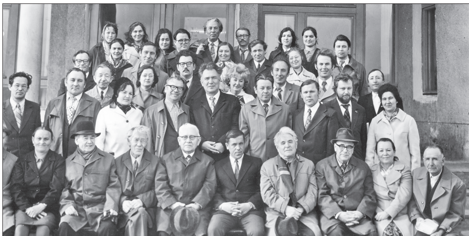
«Тукабызның тууына 89 ел тулганда, без – язучылар Кырлайда идек!» Апрель, 1975 ел.