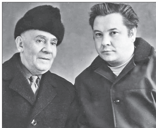
Әтисе артист Хәким Сәлимжанов белән.