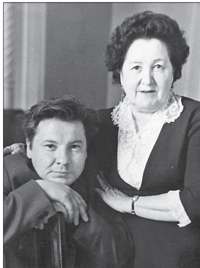
Әнисе артистка Галия Нигъмәтуллина белән.