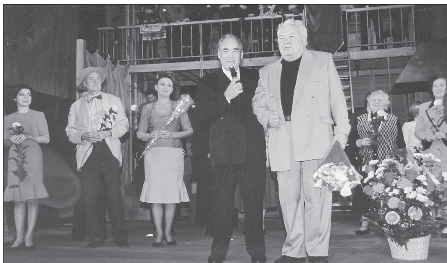
Минтимер Шәймиев Марсель Сәлимжановны 65 яше белән котлый. 1999 ел.