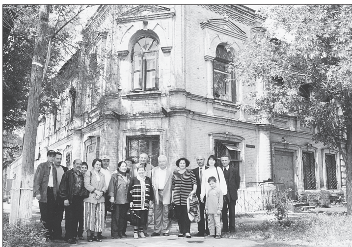
Орск гастрольләре. Әнисенең туган йорты.