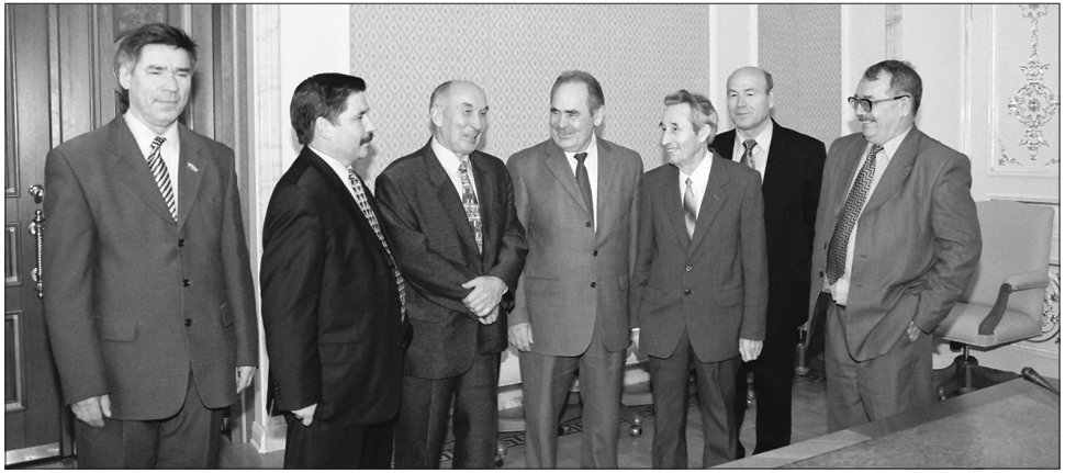
Минтимер Шәймиев (уртада) язучылар хозурында. Сулдан уңга: Фоат Галимуллин, Роберт Миңнуллин, Равил Фәйзуллин, Нурихан Фәттаһ, Флүс Латыйфи, Туфан Миңнуллин. 2002 ел.