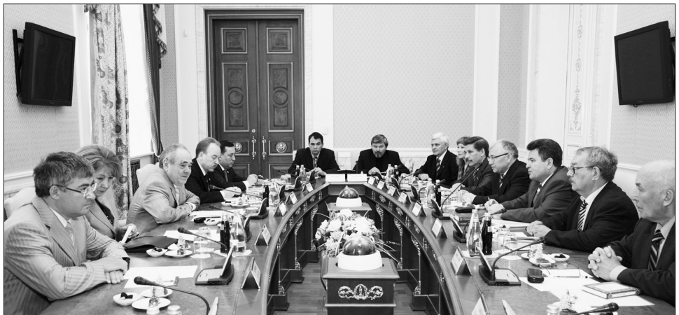
Татар язучылары белән очрашу. 2008 ел.