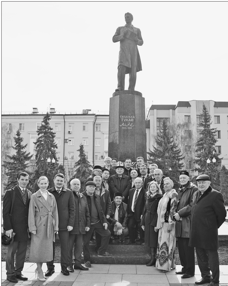
Г.Тукайның туған көнөндә Татарстан Язучылар, Театр әһелләре берлекләре ағзалары, жәмәгәтьчелек вәкилләре, «Казан утлары» журналының 100 еллык юбилей чараларына килгән кунаклар шагыйрьнең һәйкәле янында. 26 апрель, 2022 ел.